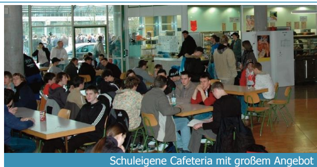
Schuleigene Cafeteria mit großem Angebot

Darüber hinaus bietet Baden-Württemberg mit seinen Dualen Hochschulen (ehemals Berufsakademien) eine berufsbezogene Ausbildung auf Hochschulniveau an.