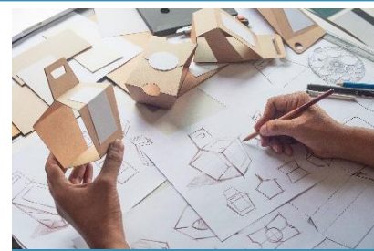
Gestaltungs- und Medientechnik