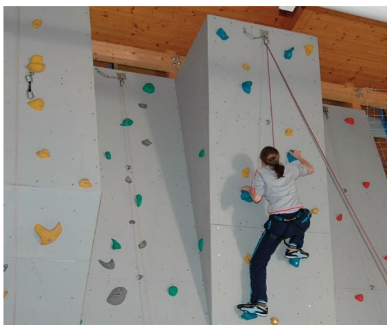
Unsere BNS1-Kletterwand: gebaut von den Schülern des Technischen Gymnasiums

und erfahre, was an der BNS1 in der Bruchsaler Südstadt abgeht.